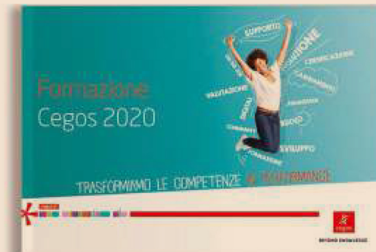
Catalogo Formazione Cegos 2020. Info: cegos.it

Cegos supporta le aziende attraverso un insieme di servizi - mappatura dei bisogni formativi, prenotazione sale, convocazione dei partecipanti, gestione delle schede di valutazione, selezione di fornitori e molto altro - con lo scopo di alleggerirle dalle incombenze operative e consentire loro un focus sulle attività maggiormente strategiche.